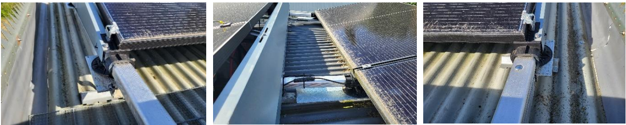
(tekst Arie Imthorn)

Op dit platte dak zijn dan ook rondom de zonnepanelen constructieverstevingen aangebracht. Het benodigde staal hiervoor is gratis geleverd door Hoogeveen Staalconstructies en vakkundig gemonteerd door Jantje de Boer, alias Paul Verhaar. De penningmeester was danig in haar nopjes. Zij kon de hand op de knip houden.