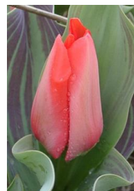
T Greigii Trauttmansdorff