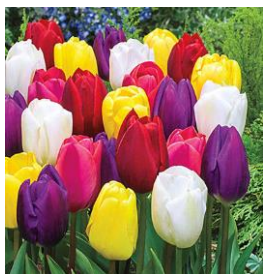
Triumf Tulp, mixed

Nu maar wachten tot het komende 'fleurige' voorjaar!