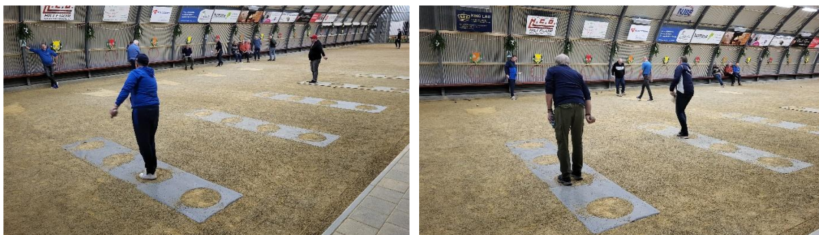
(tekst Ron Heus)

Na afloop werd er nog een suggestie gedaan om ook weer een pointeerkampioenschap te houden. Ook deze was voor het laatst in 2015. De WZ neemt dit mee voor komend jaar.